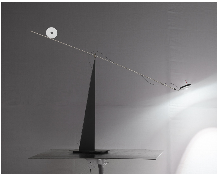
Keep Balance INGO MAURER 2016

Keep Balance ist die LED-Version und gestalterische Variante zu Ru Ku Ku. Eine flacher schwarz-weißer Korpus mit LED und eine kreisförmige, weiße Scheibe schweben an einem langen Metallstab im Gleichgewicht. Die Tischlampe hat eine Höhe von 60 cm und ist um 360° drehbar. Ein ringförmiges Gelenk ermöglicht die variable Neigung des waagrechten Metallstabs.