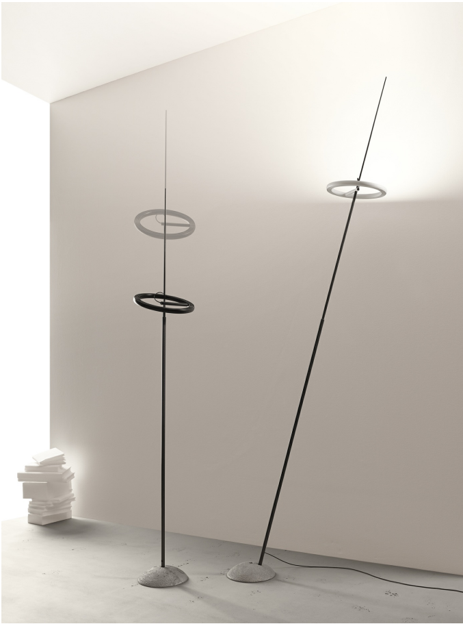
Ringelpiez INGO MAURER UND TEAM 2016

Im Sinne der vorbeugenden Verbrauchersicherheit rufen wir mit sofortiger Wirkung die Transformatoren der Ringelpiez-Modelle Ringelpiez Floor, Tisch, und Wall zurück. Wir bitten Nutzer dieser Modelle, den Transformator vom Stromnetz zu trennen und nicht mehr zu verwenden. Wir entschuldigen uns in aller Form für die Unannehmlichkeiten. Ein Test ergab, dass der Transformator trotz CE-Kennzeichnung und entsprechender Konformitätserklärung nicht sicher ist. Wir arbeiten an einem sicheren Ersatz für den Transformator, damit Nutzer die Ringelpiez-Modelle möglichst schnell wieder in Gebrauch nehmen können. Neue Ringelpiez-Exemplare werden erst ausgeliefert, wenn ein neuer Transformator verfügbar ist.